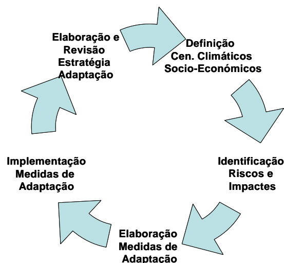
Figura 1: Metodologia Geral para Identificação e Implementação de Medidas de Adaptação

Desta avaliação deverá resultar um processo dinâmico em que as medidas de adaptação identificadas e implementadas se vão constituindo como aproximações sucessivamente mais adequadas ao ritmo com que as alterações do clima – e seus impactes – se vão fazendo sentir em Portugal.